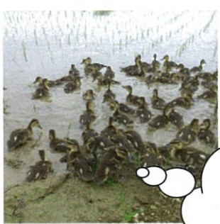
6/5~ 有機栽培米マガモ放鳥